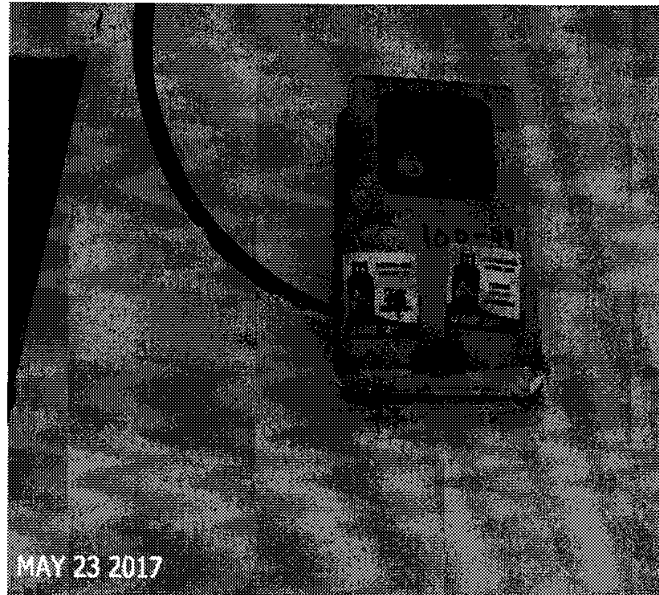
Foto N° 3 y 4 ZONA DE RETIRO DE LA QUEBRADA Y VERIFICACIÓN DE LA DIRRECIÓN