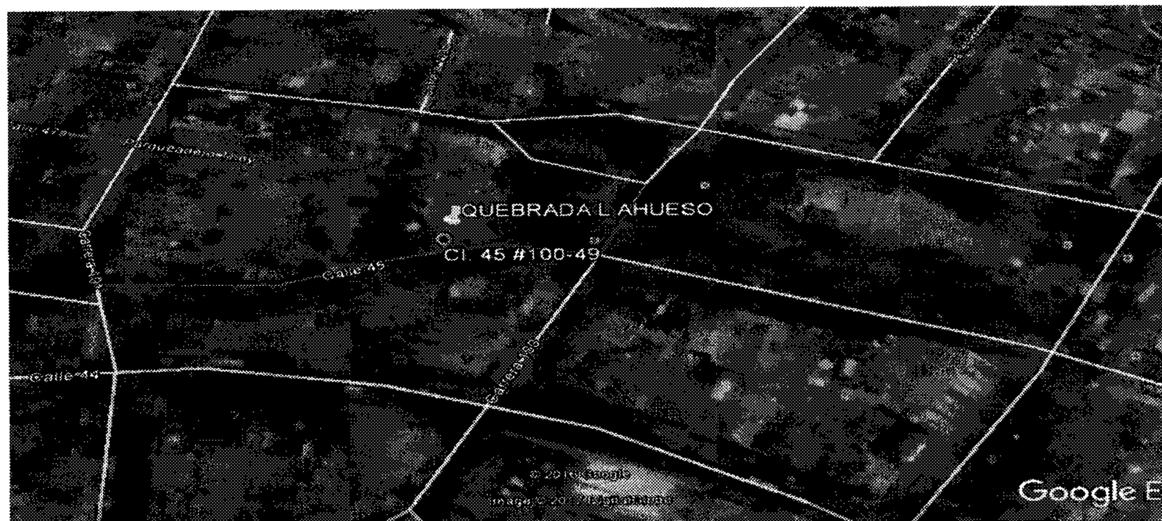
Imagen 1. Ubicación 6°15'27.00"N 75°36'57.75"O elevación 1544m Calle 45 No. 100 – 49 San Javier

Personal técnico adscrito al Área Metropolitana del Valle de Aburrá, realizó visita de control y vigilancia el 23 de mayo de 2017 (sic), a la Calle 45 No. 100 - 49 comuna 13 San Javier del Municipio de Medellín, con el fin de verificar las condiciones de la Quebrada la Hueso.